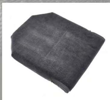
1) Dynan sedd uppifrån.

Ibland kan dynan till Bambino och Micro behöva anpassas till sittdjupet på rullstolen. Följ anvisningarna nedan.