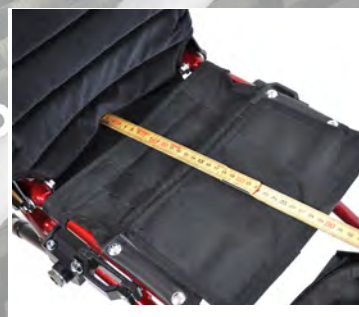
5) Mät ut på rullstolen vilket djup dyna ska ha.