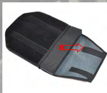
3) Drag ut dynan med överdrag.