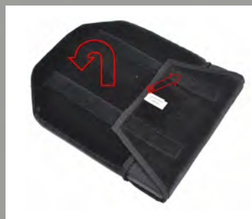
2) Vänd på dynan och lyft på fliken som sitter med kardborreband.