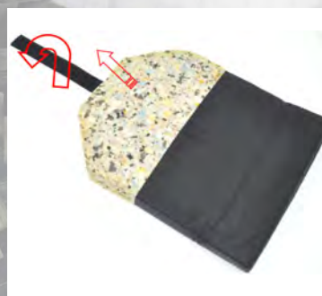
4) Lossa på flärpen som sitter med kardborreband och drag ut skumplastdynan.