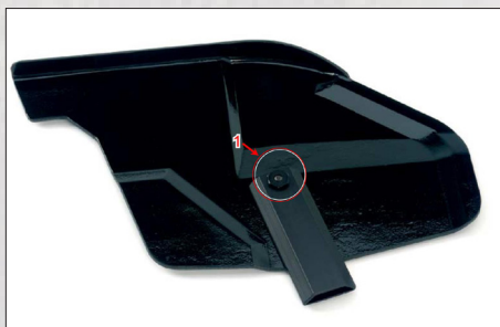
Fig.1 Sidoskydd med skärm

art.nr. 4420010 Sidoskydd m. skärm kpl par art.nr. 4200040 Sidoskydd m skärm för 26"-hjul par