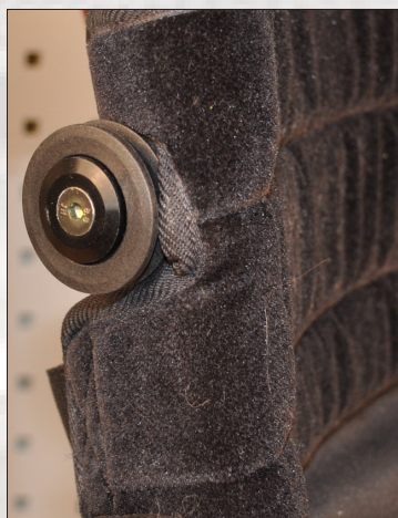
Fig.5 Fästet på ryggen

Lossa något på sittklädselns justerband. Montera sidoskyddsfästet på chassit löst enligt fig 3 och 4. (Bulten med sexkantskalle (fig 3 pos15) skall sitta närmast ryggliden på bägge sidor).