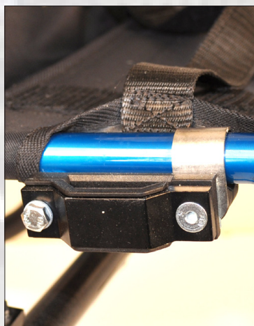
Fig.4 Fästet på chassit